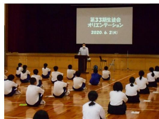
《生徒会オリエンテーション》

13の部活動の主将、部長が活動内容を簡単に説明しました。これを参考に体験入部をして、6月中旬に入部します。