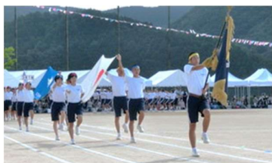
校旗を先頭に入場行進