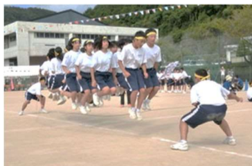
学級対抗 大縄飛び